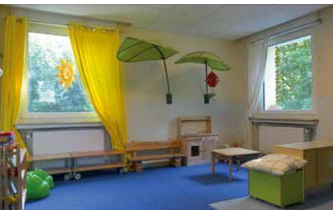
Die Innenräume der beiden Kitas in Schwaney (obere zwei Fotos) und Bad Lippspringe Fotos oben: St. Johannes Baptist Foto unten: Familienzentrum St. Josef

morgens abgeben müssen, obwohl sie uns vertrauen und sie wissen, dass ihr Kind bei uns gut aufgehoben ist.