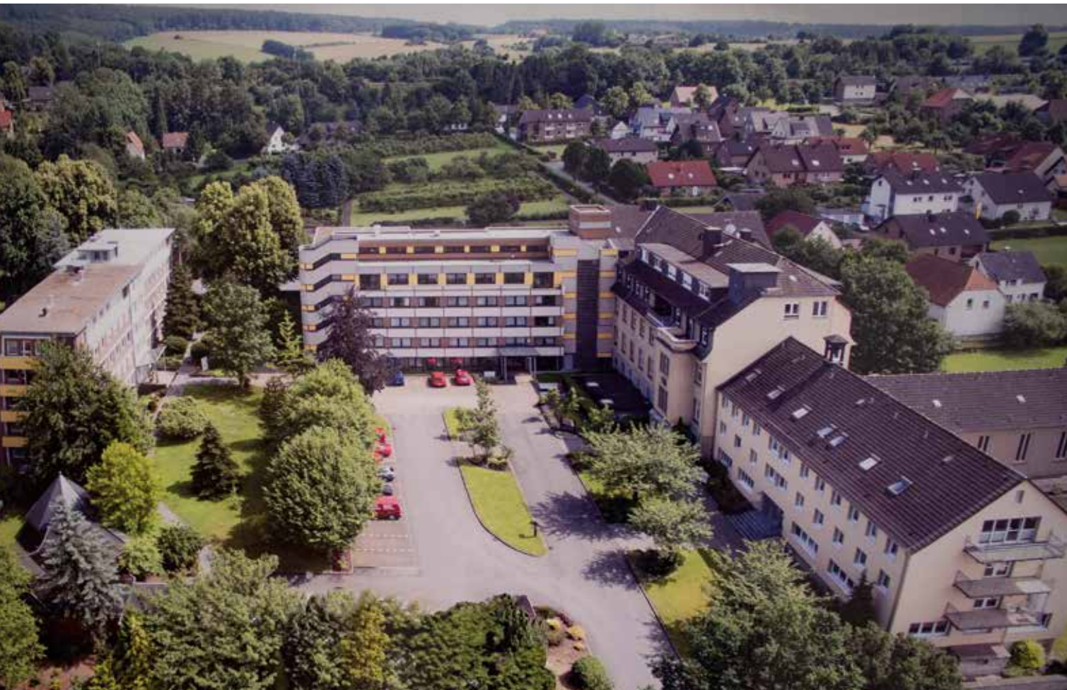
Foto oben: Das Kloster der „Schwestern vom Kostbaren Blut“ in Neuenbeken.