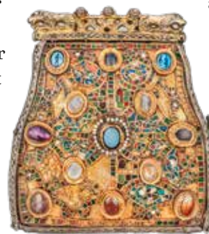
Die Burse von Enger

Vielleicht die wichtigsten Kulturtechniken, die Klöster pflegten, waren Schrift und Buchmalerei. In Paderborn zu sehen sind