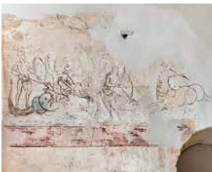
Wandmalerei Odysseus und Skylla

Gleich zu Beginn der Ausstellung fletscht eine Bärin drohend die Zähne. Die 2.300 Jahre alte Bronzefigur steht sinnbildlich für das zentrale Thema der großen Mittelalterschau: die Aneignung und Übernahme der Antike im fränkischen Reich der Karolinger.