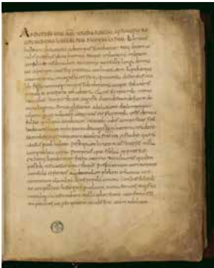
Die Annalen von Tacitus

Das Mittelalter war nicht, wie immer noch behauptet, dunkel und kultur- und geschichtsvergessen. Ort der antiken Kulturbewahrung und -weitervermittlung waren Klöster, unter ihnen die Benediktinerabtei in Corvey. Daran erinnert die aktuelle Ausstellung „Corvey und das Erbe der Antike“ im Paderborner Diözesanmuseum.