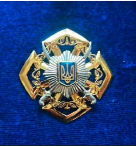
Die militärische Auszeichnung, die Anatolii Andreiev für seinen Einsatz für einen verwundeten Soldaten erhalten hat.