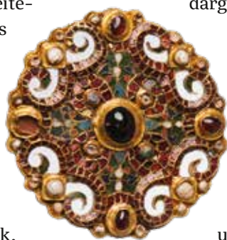
Fibula van Dorestad

Eine Sensation ist die einzige erhaltene Kopie der ersten sechs Bücher der Annales von Tacitus in der Ausstellung. Wahrscheinlich kopierte ein Mönch in Fulda das Werk, bevor das Buch in die Corveyer Klosterbibliothek kam. 1508 wurde es gestohlen – angeblich, um es zu retten – und gelangte in den Besitz des Medici-Papstes Leo X. Ins Diözesanmuseum sind die Annales als Leihgabe der Biblioteca Medicea Laurenziana gekommen.