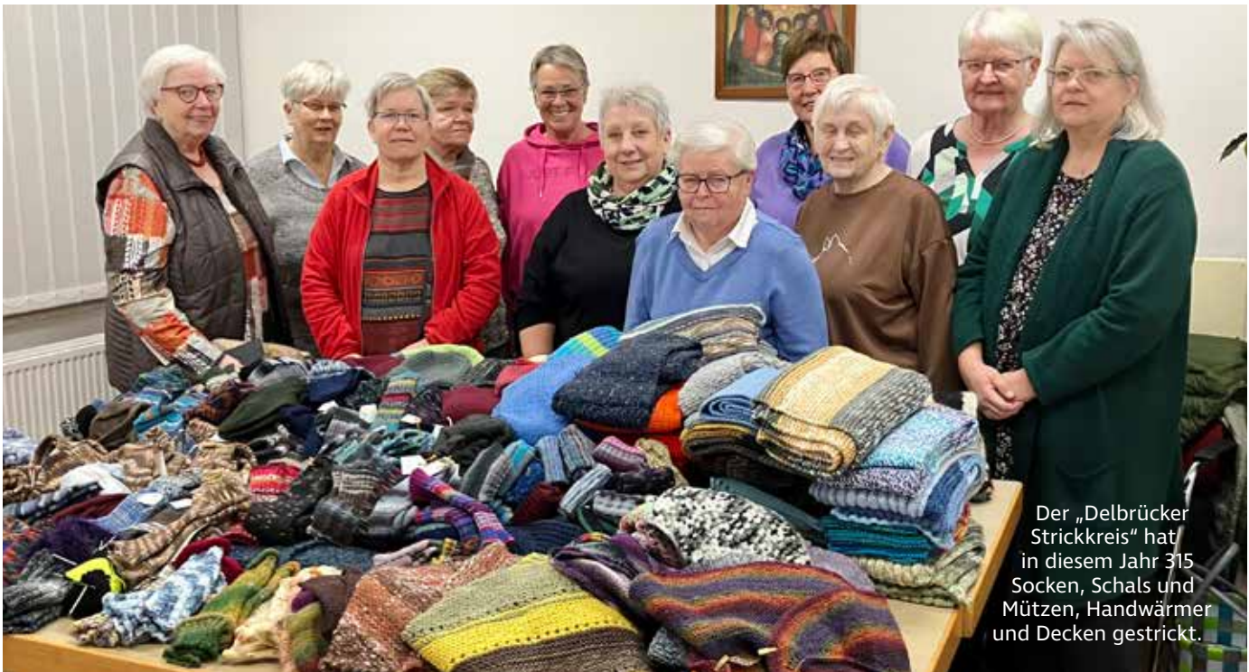
Der „Delbrücker Strickkreis“ hat in diesem Jahr 315 Socken, Schals und Mützen, Handwärmer und Decken gestrickt.

GITTERZÄUNE HOLZZÄUNE CARPORTS SICHTSCHUTZ RANKANLAGEN GABIONEN SCHIEBE- UND ROLLTORANLAGEN