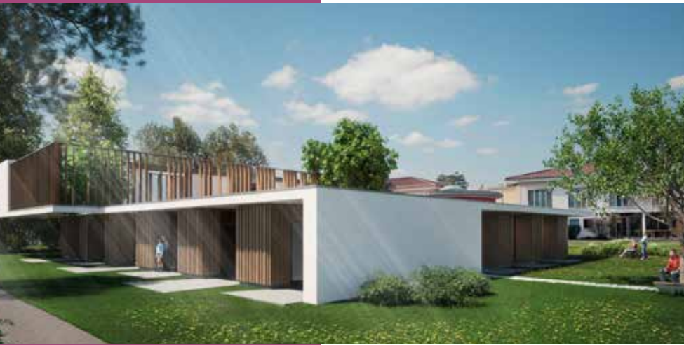
Entwurf des neuen Hospiz- und Palliativzentrums „Pauline“